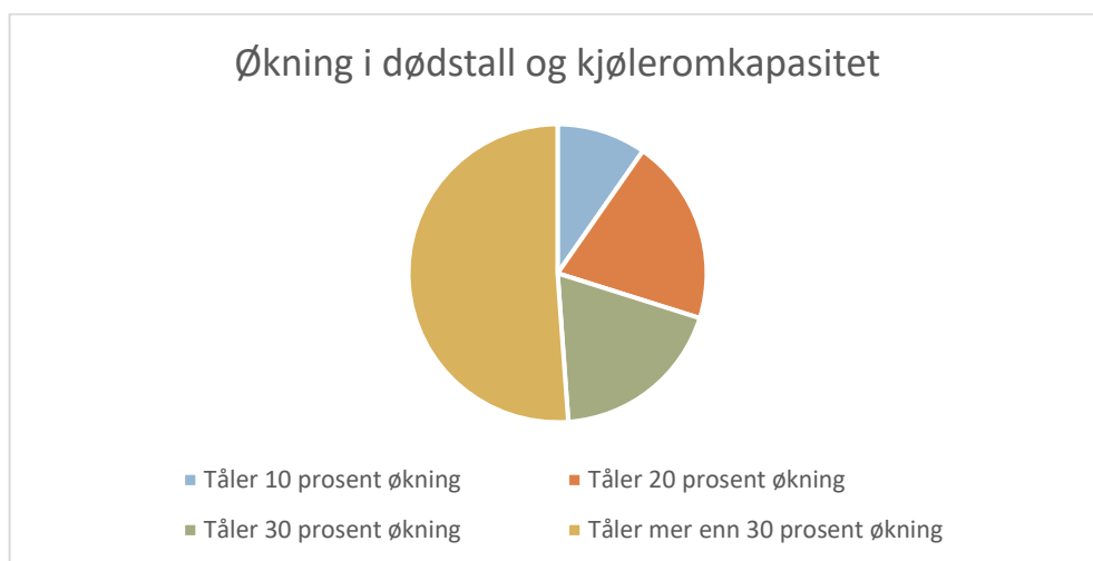
Graf 2 Økning i dødstill og kjølekapasitet

Dette punktet er et envalgspunkt, og respondentene havner derfor i kun en av de fire gruppene.