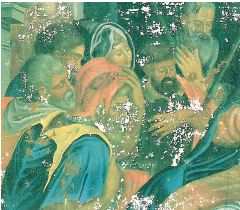
Illustrasjoner denne side og neste: Hyrdene ved krybben, detalj av Julenatt. Lerretningsmaleri i Bønsnes kirke, Hole kommune i Buskerud.

Over denne side: Før behandling. Under denne side: Bildet er konserverert, rensert og kittet. Neste side: Etter konservering og restaurering.