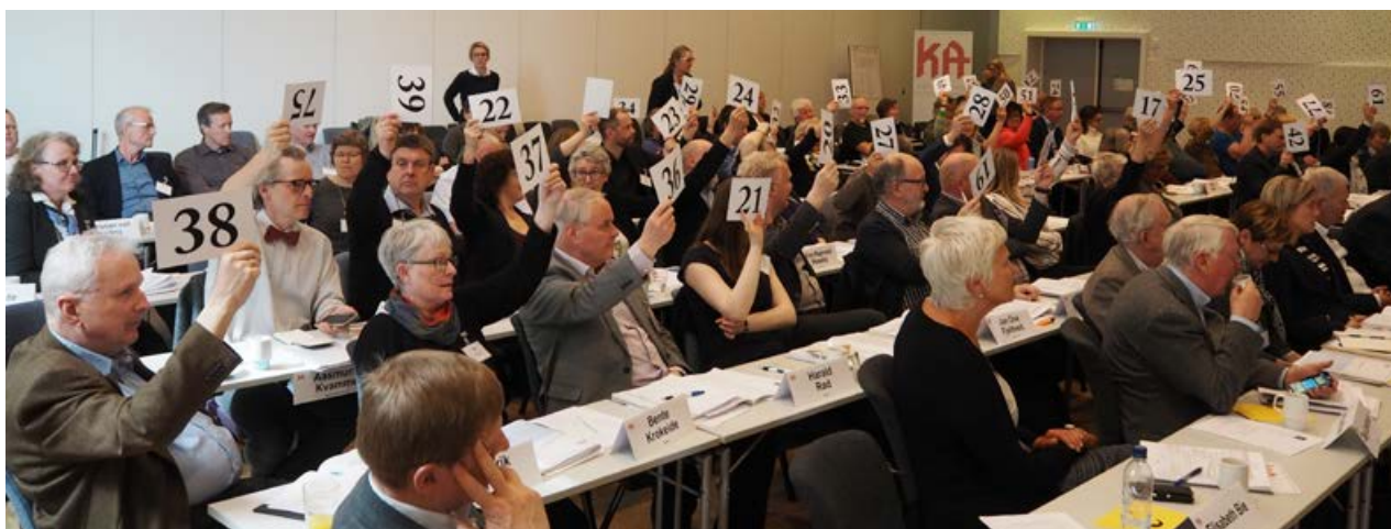
Det ble avholdt ordinært landsråd i KA i 2017 (bildet). I 2018 ble det avholdt ekstraordinært landsråd.

Under Kirkemøtet i april 2018 ble det vedtatt en uttalelse som i stor grad tilslutning til hovedtendensene i høringsvarene fra de lokale rådsorganene. Resultatet ble derfor at Den norske kirke stod relativt samlet når det gjelder de viktigste veivalgene for innretningen av en framtidig lov for tros- og livssynssamfunn. KAs landsråd, som var samlet siste uken av april, gjorde deretter et enstemmig vedtak om innretningen av handlingsmål på kirkeovfeltet i behandlingen av ny strategiplan for 2018-2021.