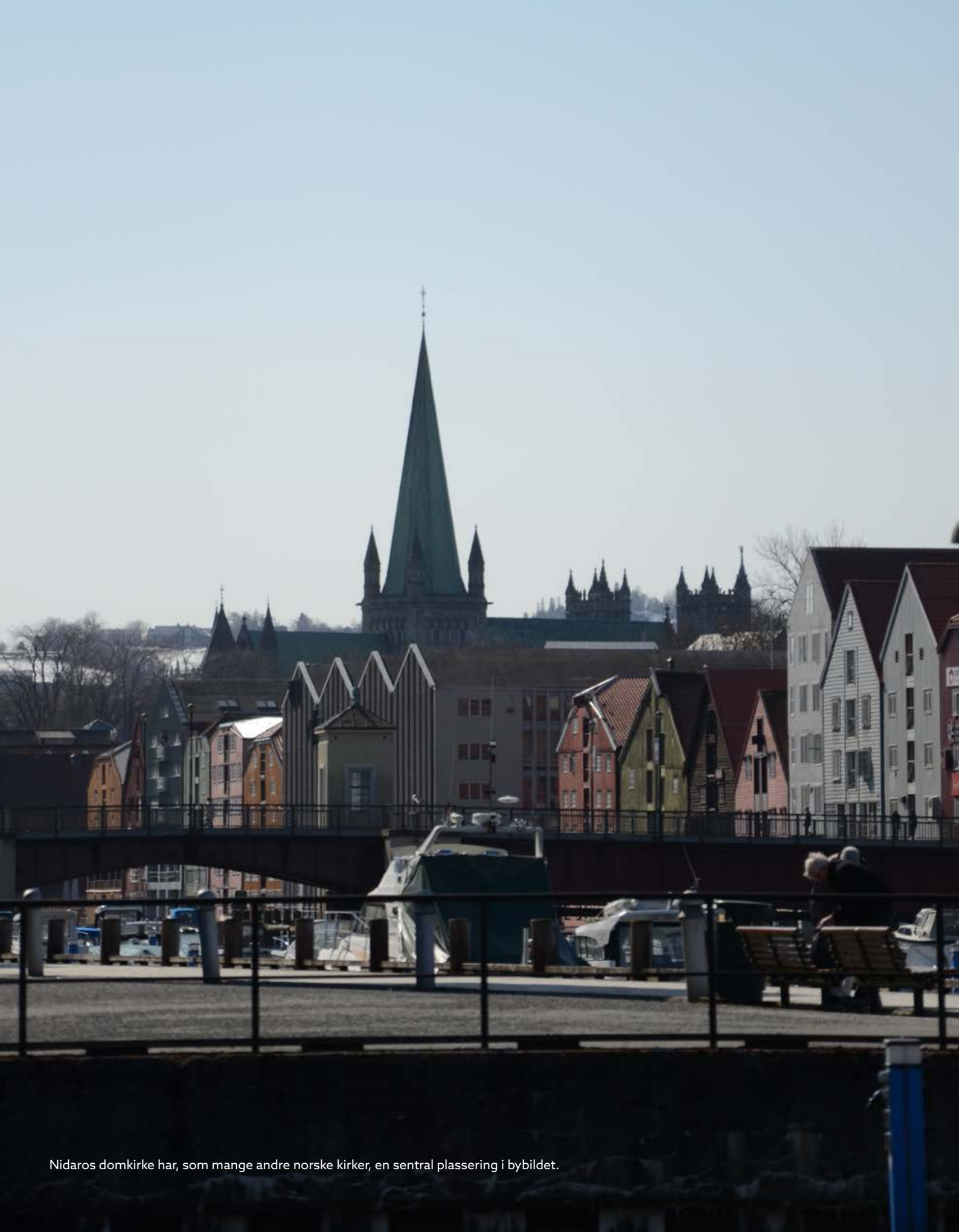
Nidaros domkirke har, som mange andre norske kirker, en sentral plassering i bybildet.