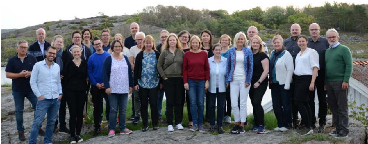
De ansatte i KA samlet på Koster under stabstur i september 2018.

På det interessepolitiske området har det vært langt ned mye arbeid for å avklare spilleregler på områder der det eksisterer ulike synspunkter