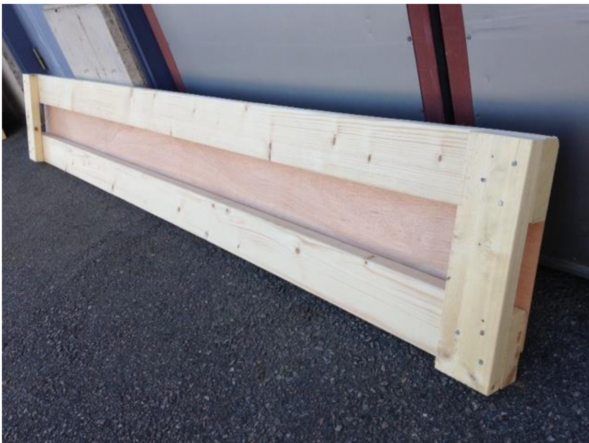
Bilde: Side til stempling i tre. Her benyttes K-virke og finerplate.

Manuell gjenkasting av grav kan representere en viss risiko. Dersom det er mange i gravfølget som bidrar samtidig kan situasjonen bli uoversiktlig og faren for at man dulter borti hverandre blir større. Er det vått, snø eller is kan det bli glatt med risiko for fall. Der stimplingsutstyret skal heises opp igjen etter gjenkasting må dette stikke noe opp over gravkanten. Dette gir en viss snublerisiko. En bør derfor gjøre vurderinger om det er behov for å sette begrensinger for hvor mange som kan kaste igjen om gangen, om det skal treffes særskilte tiltak for å sikre arbeidet med tilrettelegging rundt graven, valg av type masse etc. Finnes det metoder for skliskring? Vil for eksempel kunstgressmatte være til hjelp, eller vil denne bli ekstra glatt når den blir våt og sand eller jord trampes ned i den?