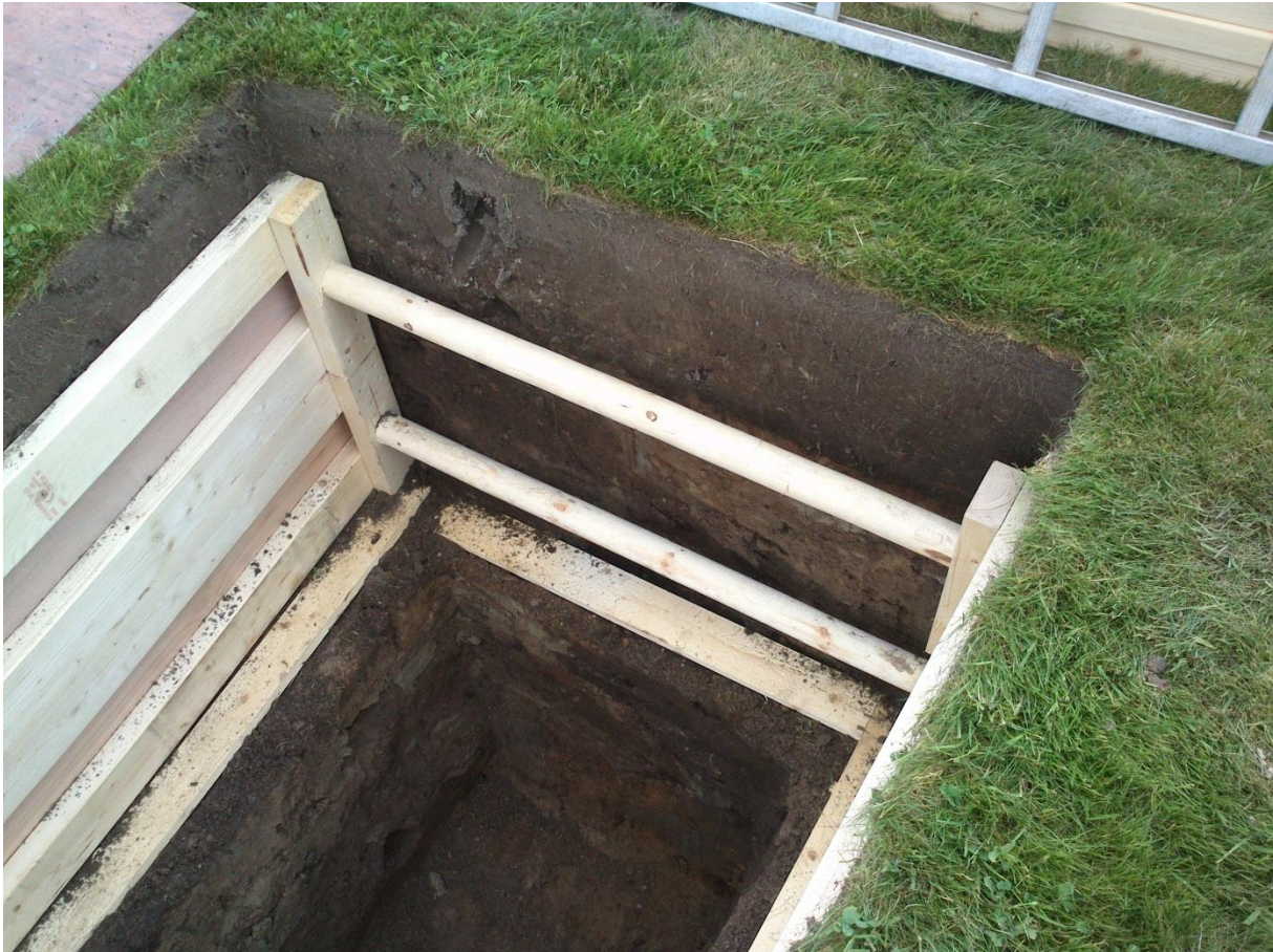
Bilde: Her vises en stemplingskasse som blir benyttet ved alle kistebegravelser på Sigelhultskyrkogård, Uddevalla i Sverige. Denne blir etterlatt i graven etter gjenkasting.

I de tilfeller hvor deltagere i gravfølget skal ned i graven, er det avgjørende at graven stemples slik at den sikres mot ras. Med standard stemplingsutstyr kan dette bli problematisk. Dette handler både om plass nok nede i graven og demontering av stemplingsutstyret når gravfølget skal kaste igjen selv. Det finnes noen mulige løsninger i handelen, men disse vil ikke passe ved alle jordforhold. En annen mulighet er å lage en stemplingskasse av tre som blir igjen i graven. Treverket vil med tiden bli helt nedbrutt, så lenge det er tilstrekkelig vann- og luftgjennomstrømningen i jorden. I Sverige er det flere forvaltninger som benytter en slik løsning ved ordinære gravferder.