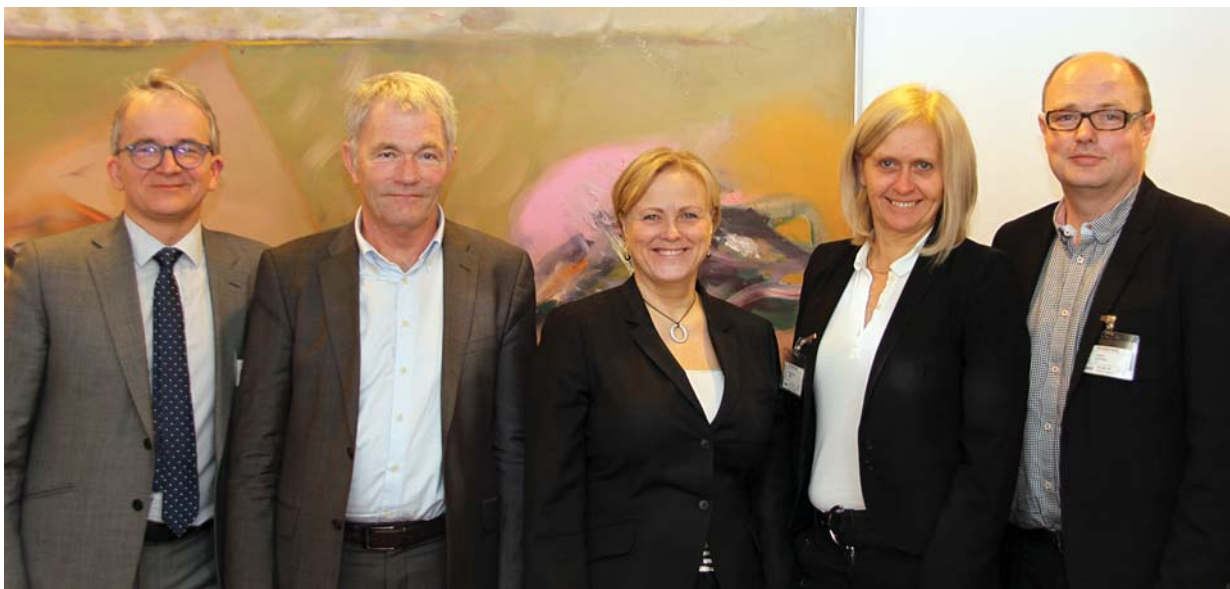
Møte med Kulturminister Torbild Widvey

Det er avgjørende å kunne tilby individuell medlemsrådgivning basert på god kjennskap til kirkelovgivning, kommunenes rammebetingelser og de særlige utfordringene knyttet til forvaltning av kirkebygg. KA har bl.a. gitt rådgivning til flere fellesråd som har kommet i økonomisk uføre på bakgrunn av reduserte bevilgninger, manglende økonomistyring eller andre kritiske forhold. Andre områder med mye fokus i medlemskontakten i 2013 har vært praktisering av lov om offentlige anskaffelser, kirkelige eiendomsforhold, håndtering av såkalte «kataloghaier», pensjons-spørsmål, opphavsrettslige spørsmål, tilrettelegging av kirker og kirkelige tilbud for de som har funksjonsnedsettelse, praktiseringen av budsjett- og regnskapsregler og momskompensasjon.