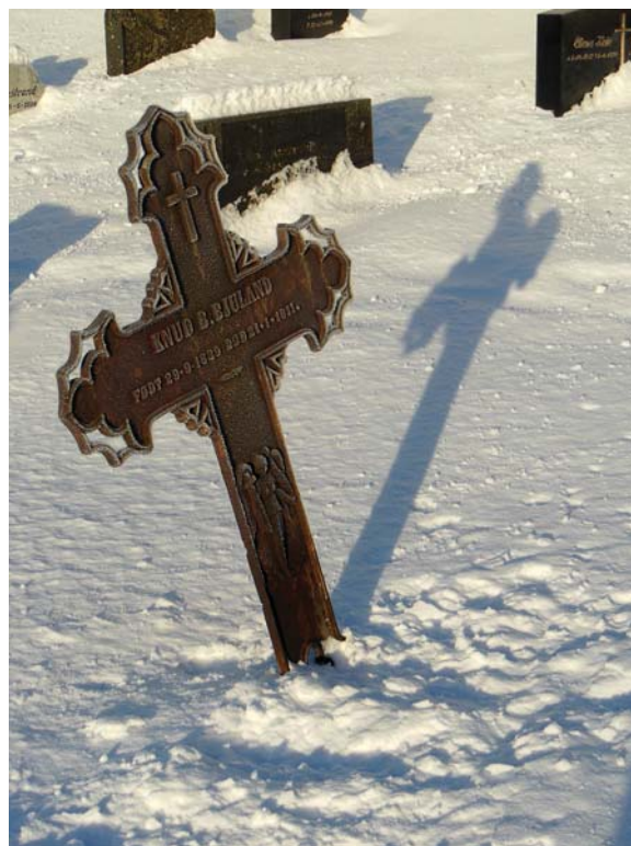
Støpejernskors fra Jæren

KA påtok seg i 2012 ansvaret for å utvikle bedre IKT-verktøy for gravferdssektoren, det er bl.a. et særlig behov for stedfestede data som kan knyttes til eksisterende forvaltningsverktøy. I 2013 ble det igangsatt et arbeid for å utvikle en såkalt SOSI-standard for gravplassfeltet, dette innebærer bl.a. fastsetting av et grunnleggende felles begrepsapparat i forhold til kart og forvaltningsverktøy på sektoren.