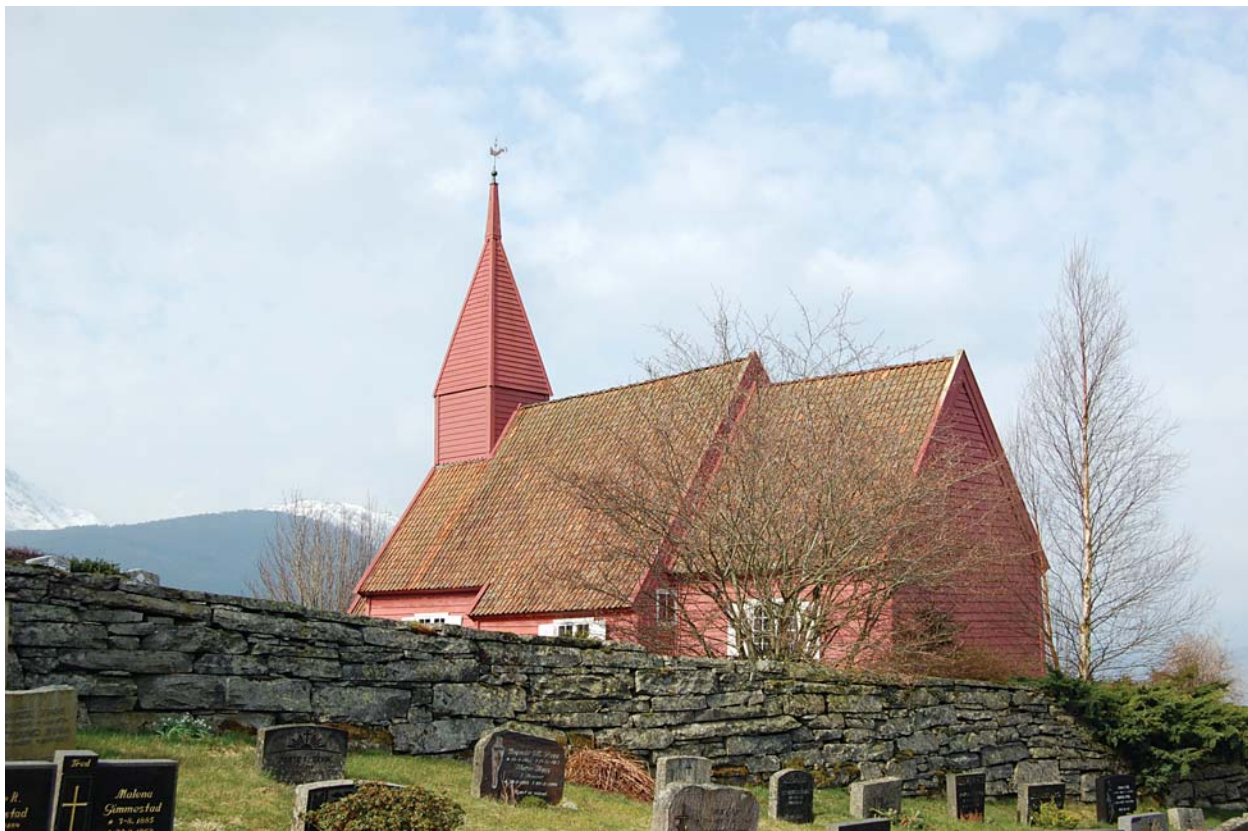
Gimmedal gamle kirke

Mellomoppgjøret 2013 innebar en totalramme på 3,76 % i årslønnsvekst. Det ble gitt et generelt tillegg til alle arbeidstakere som omfattes av sentral lønnsfastsettelse på 0,75 %, minimum 3 100 kroner. Den samme justeringen ble gjort i minstelønnen i de ulike lønnsgruppene. Garantilønnen for ansatte med 20 års ansiennitet ble justert ytterligere, etter endringer i